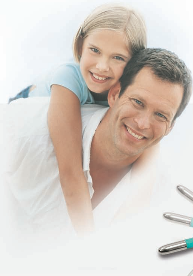
TD-20 Rigid tip - punta rigida