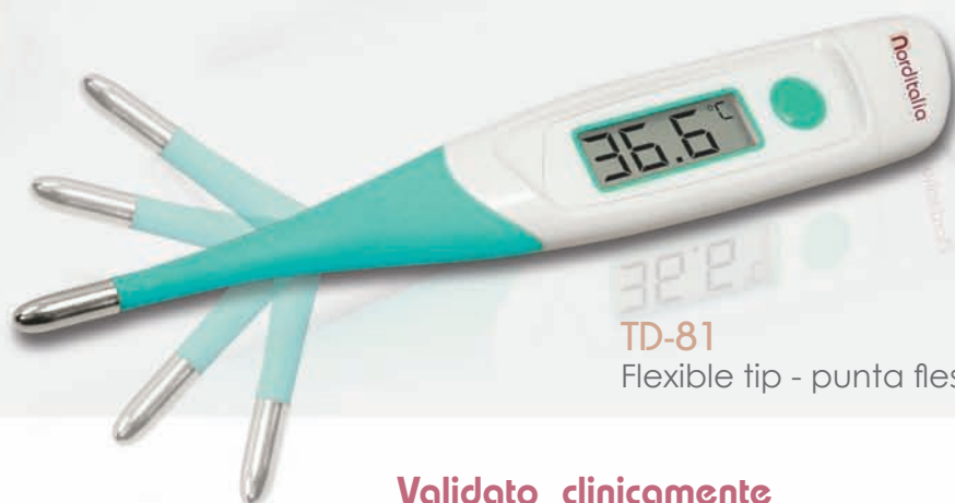
TD-81 Flexible tip - punta flessibile